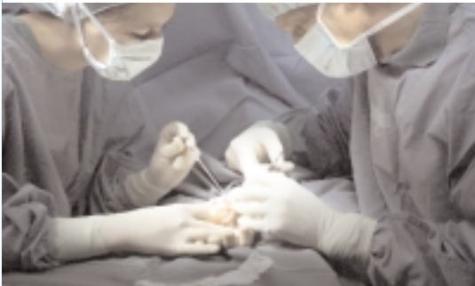
Die neue Station