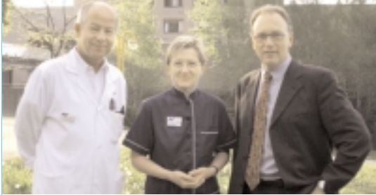
Die kollegiale Führung

An forderster Front für den Patienten: im ärztlichen Bereich, in der Pflege, bei der Therapie und in der Verwaltung.